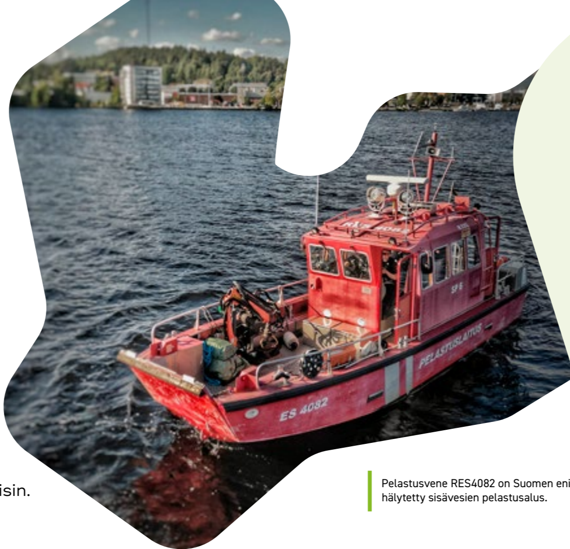
Pelastusvene RES4082 on Suomen eniten hälytetty sisävesien pelastusalus.

Vesisukellus on pintapelastusta vaativampaa vesisukelluslaitteiden avulla tehtävää vesipelastusta. Kaikilla pelastajilla ei ole vesisukeltajan pätevyyttä. Etelä-Savon pelastuslaitoksella pyritään siihen, että kussakin työvuorossa olisi vähintään kaksi vesisukelluskelpoista pelastajaa.